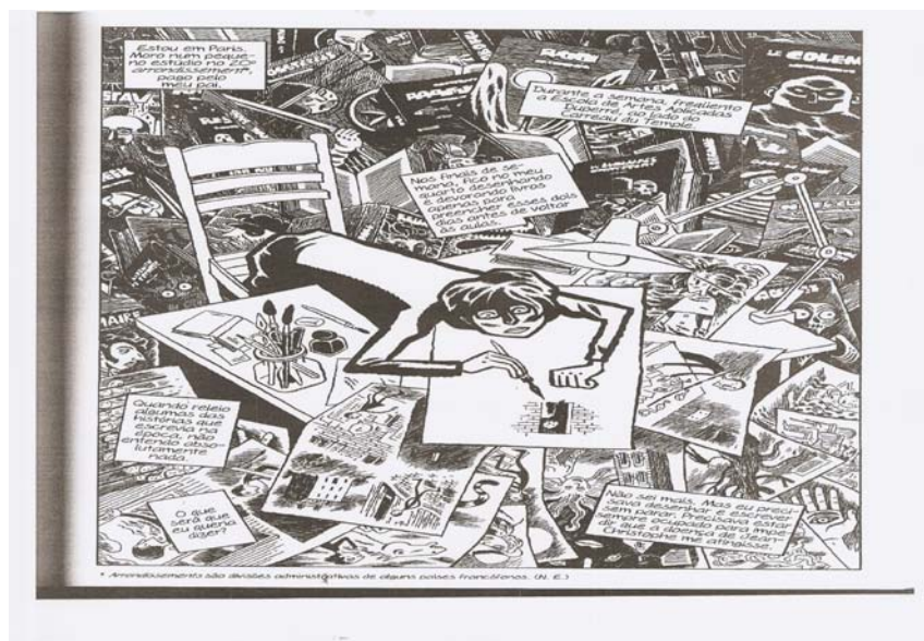
Figura 2. B, David. Epileptico 2 , p.121.

experiência com seus desenhos de batalhas na infância e depois com seus traços na adolescência, da floresta imaginária e seus convivas que são também seus interlocutores, companhias. Sobre a importância da escrita de si como prática de liberdade Michel Foucault observa que ela: “atenua os perigos da solidão; dá ao que se viu ou pensou um olhar possível; o facto de se obrigar a escrever desempenha o papel de um companheiro” (FOUCAULT, 2009b, p.130).