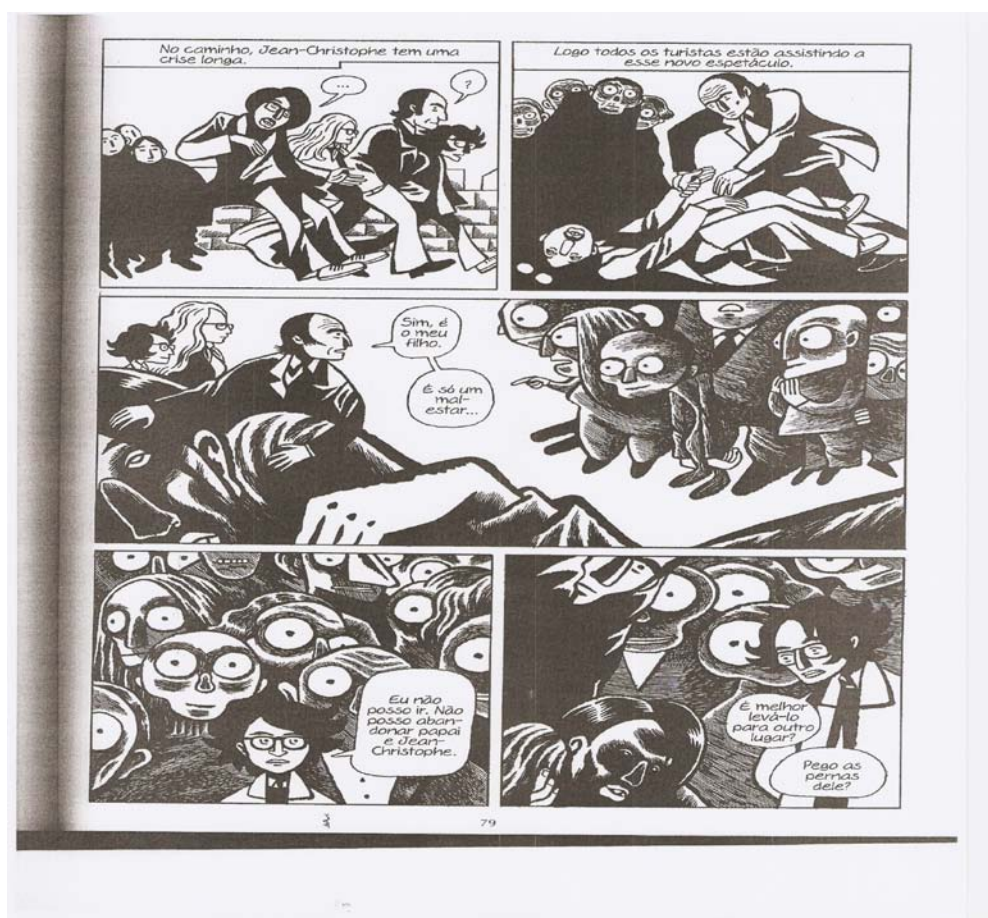
Figura 5. B, David. Epiléptico 2 , p.79.

A epilepsia definida pelo irmão narrador “como um relógio que comanda nossa vida” (B., 2007, p.88), apresentada como um adversário invisível que destrói com seus golpes toda a família, parece unir, nos mais variados espaços um corpo ávido para o espetáculo das crises, para a chegada de um dispositivo de controle que a corrija e a elimine. É recorrente no transcorrer da narrativa o aparecimento de bombeiros, policiais e de pessoas amedrontadas com as crises.