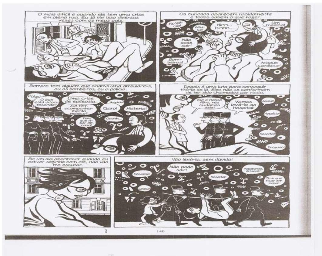
Figura 1. B, David. Epilético I , p.140.

que o penetram e o envolvem de um espectro ameaçador, perigoso. Michel Foucault a partir de sua perspectiva genealógica em A verdade e as formas jurídicas apresenta a emergência de alguns modelos de verdade e seus efeitos na constituição do sujeito de conhecimento. Desse modo, seus questionamentos sobre como se puderam formar domínios de saber a partir de determinados regimes de verdade, disposições, técnicas sociais converge com uma das inquietações de Davi B. analisadas nesse artigo, a de como o irmão se tornou “O Epiléptico” abjeto.